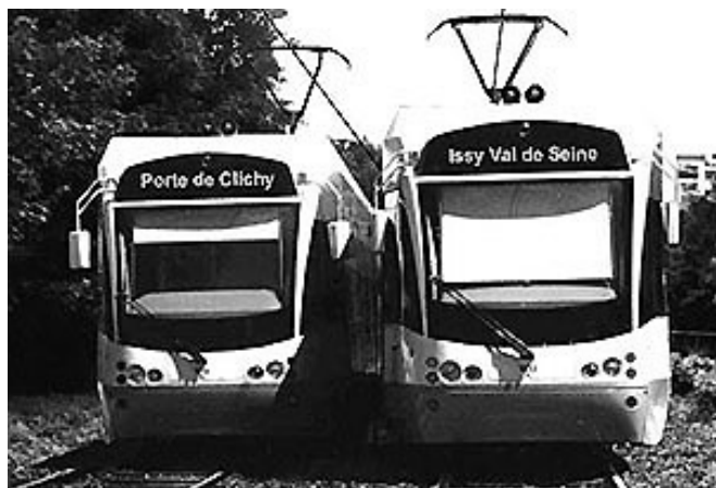
Photomontage : tramways sur la Petite Ceinture