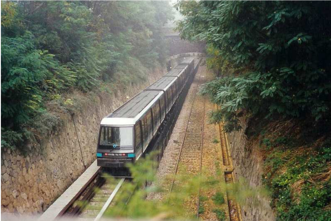
Rame à conduite automatique en essai en octobre 1996 sur la Petite Ceinture dans le 13 e arrondissement, pour préparer la mise en service de la ligne 14 du Métro parisien.